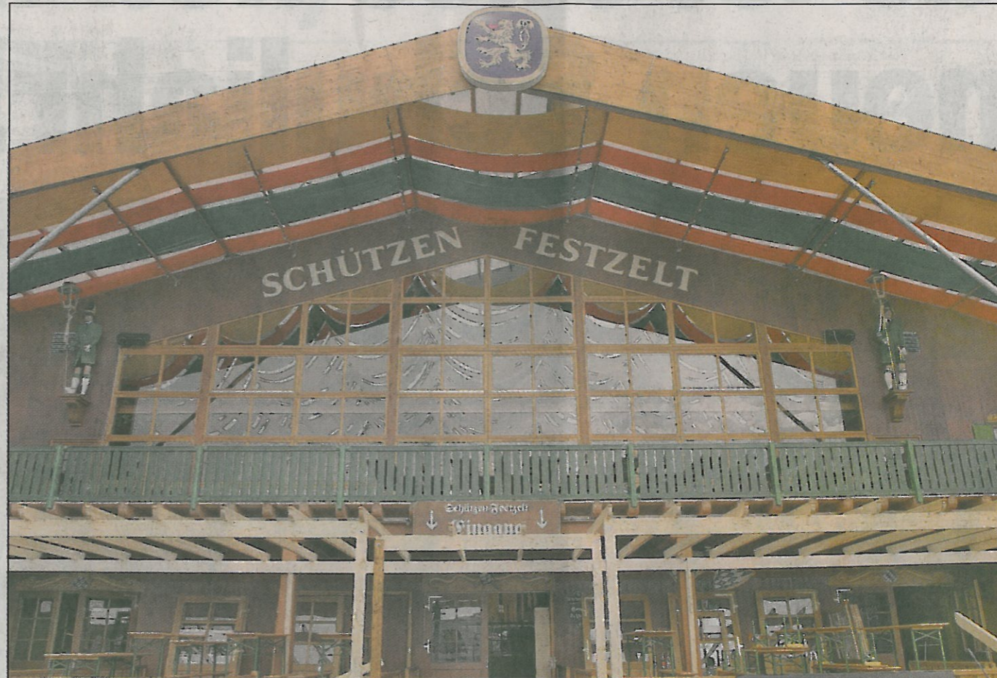
Das Schützenzelt am Fuß der Bavaria – genau 5000 Gäste haben im Inneren des Zelts Platz

Hier trifft sich, neben den Schützen, die gediegene Münchner Gesellschaft. Vor allem große Firmen und Banken feiern hier gerne – auch mit ihren Geschäftspartnern aus aller Welt. Schon wegen des ausgezeichneten Essens.